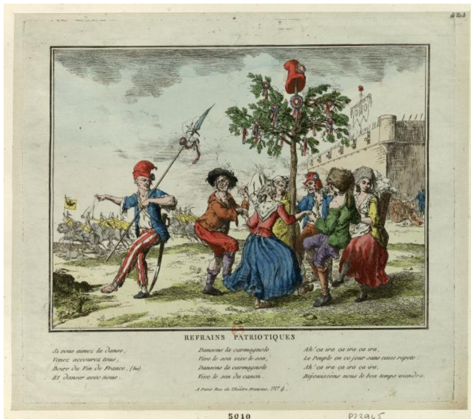
Patriotische Gesänge, Carmagnole [ Refrains patriotiques ] 1, 1792-1795, kolorierte Radierung