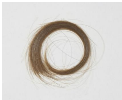
Georg Büchner, Haarlocke, 1837, Kopfhaut Georg Büchner Gesellschaft e.V., Marburg

Wartburg statt, welches gegen das „System Metternich“ 7 Stellung bezieht. 1819 segnet der Frankfurter Bundestag die sog. Karlsbader Beschlüsse ab und dies bedeutet die Verfolgung sog. Demagogen (Systemkritiker), eine Verschärfung der Zensur und ein Verbot der Burschenschaften. 1821 wird Büchner in einer privaten Erziehungsanstalt für Knaben eingeschult. Vier Jahre später wechselt er aus der Grundschule ans humanistische Großherzogliche Gymnasium. 1828 wird er konfirmiert, gründet einen literarischen Schülerzirkel und schreibt erste Gedichte. Es folgen bemerkenswerte Schulaufsätze und während der Pariser Juli-Revolution 1830 eine Rede auf einer Schulfest.