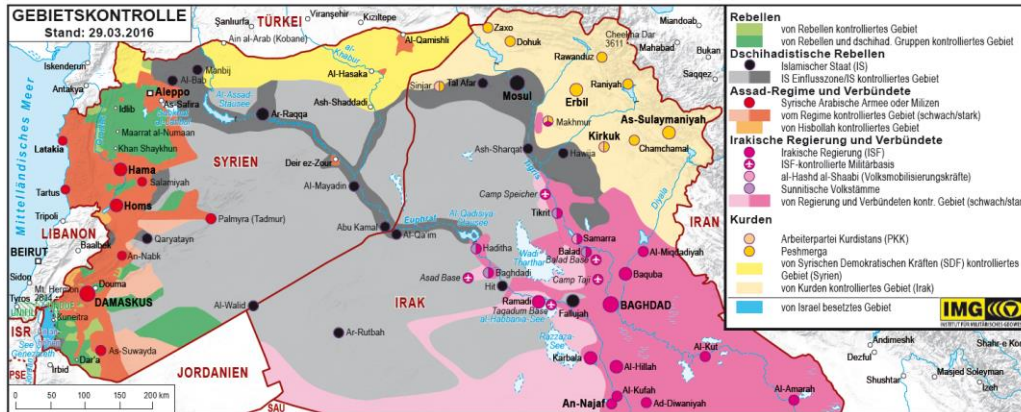
Abbildung 2: Gebietskontrolle in Syrien und Irak

wahrscheinlich auch unter Schiiten rasch schwinden, wenn sie sich offen gegen Sistani stellen würden, auf dessen Legitimierung sie sich nach wie vor berufen. Dennoch wird es nur dann eine Chance zur Lösung geben, wenn die sektiererische Gewalt der schiitischen Milizen unterbunden wird und die Regierung, die USA und ihre Verbündeten wie auch der Iran statt einer militärischen eine politische Lösung im Kampf gegen den IS anstreben. 52