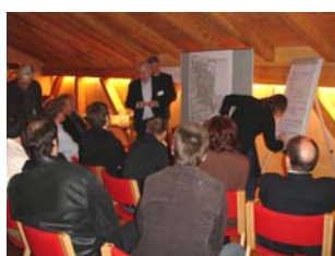
Arbeitsgruppe 1 Bauen, Raum, Kulturgüter