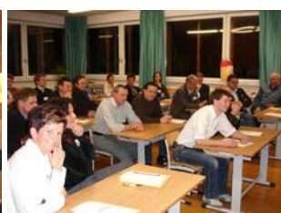
Arbeitsgruppe 2 Land-/ Forstwirtschaft, Natur, Umwelt