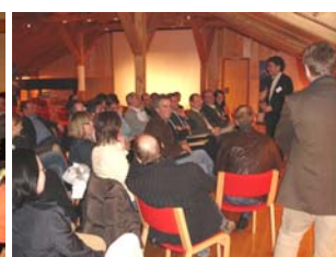
Arbeitsgruppe 4 Kulturelles Leben