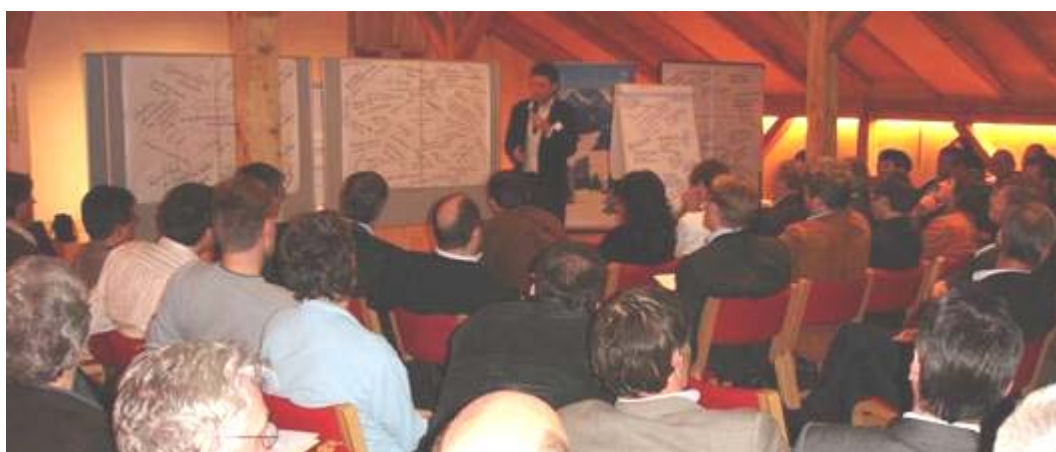
Präsentation der Ergebnisse

Dokumentation und Ergebnisse Auftaktveranstaltung am 30. März 2007 im Kleinen Dorfsaal, Schwarzenberg