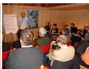
Arbeitsgruppe 3 Wirtschaft, Tourismus, Verkehr