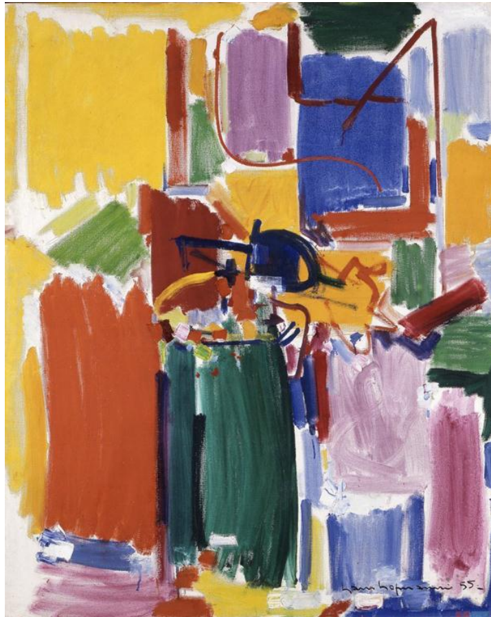
Hans Hofmann, Radiant Space (Leuchtender Raum), 1955, Öl auf Leinwand, 152,0 x 122,0 cm, Indianapolis Museum of Art 3

auch für die Gegenwartskunst geöffnet und weltweit wieder in die öffentliche Wahrnehmung gerückt hat, hat mit seinem überwältigend umfangreichen und vielgesichtigen Ausstellungsprojekt „Das Geistige in der Kunst: Vom Blauen Reiter zum Abstrakten Expressionismus“ (31.10.2010 - 27.2.2011) als erster in dieser Fülle den Bogen gespannt zwischen den Münchener Künstlern um Kandinsky und Marc und den New Yorker Freunden von Mark Rothko, Barnett Newman und Ad Reinhardt. Mit sehr bekannten und einigen weniger prominenten Namen werden dabei zugleich selten oder noch nie gesehene Werke präsentiert, was die mit über 250 Werken sehr umfangreiche Schau auch zu einem visuellen Abenteuer ohnegleichen macht.