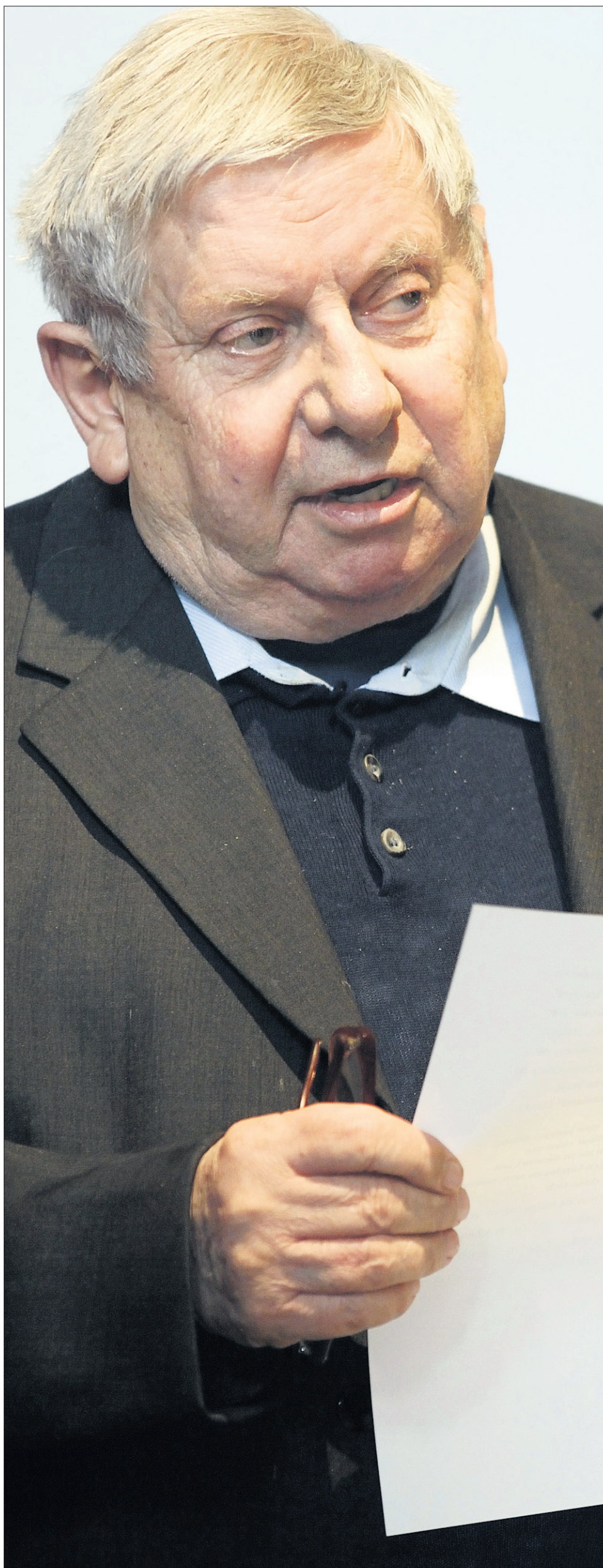
AUTOBIOGRAFIE Ohne Eitelkeit gibt Hugo Loetscher Eindrücke des Erlebten wieder.

In seinem neusten Buch «War meine Zeit meine Zeit» blickt der 80-jährige Schriftsteller über die Sihl und auf ein ereignisreiches Leben zurück.