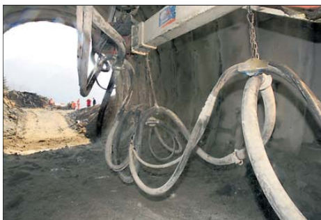
Etwa 6,5 Millionen Euro haben die einspurige Asphaltstraße und der Tunnel gekostet – im Juni sind sie fertig geworden.