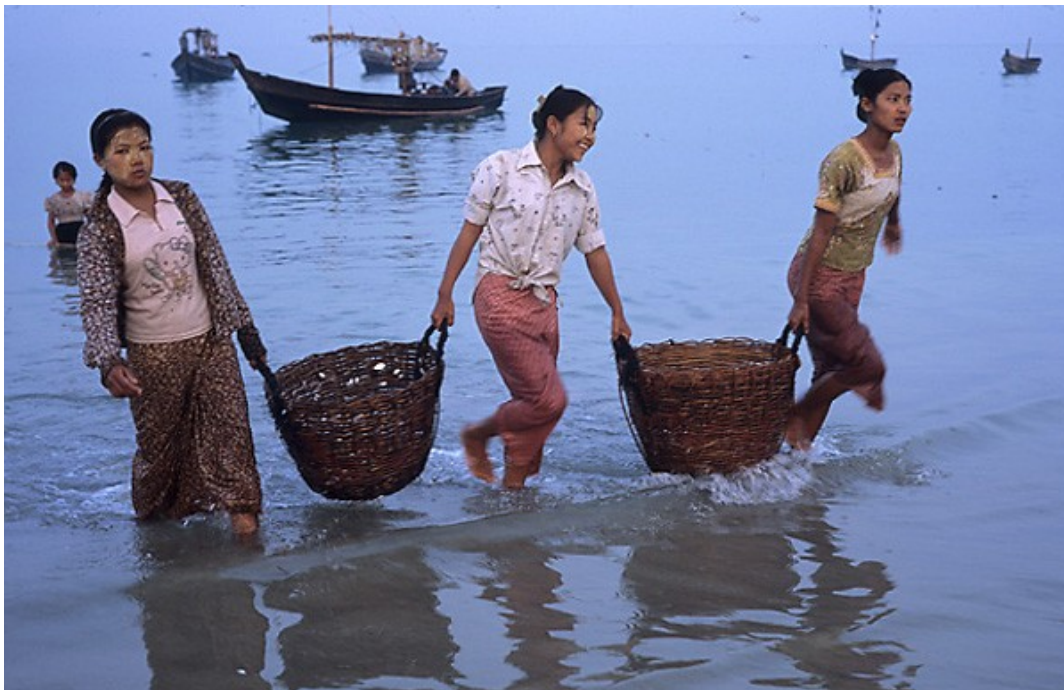
In multidimensionaler Verbundenheit

Die Materie existiert vor dem Hintergrund der ewigen (= raum- und zeitlosen) Welt des Absoluten und bringt ewiglich vergängliche Formen hervor, angefangen mit den zahllosen Universen, die zuerst in einer feinstofflichen Form entstehen. Es gibt feinstoffliche und grobstoffliche Materie und dementsprechend feinstoffliche und grobstoffliche Welten. Ebenso haben die Menschen einen feinstofflichen und grobstofflichen Körper. Die multidimensionale Materie ist Projektionsfläche des Bewusstseins. Information ist Ausdruck von Bewusstsein und ist – noch vor Energie und physikalischer Materie – der grundlegende Faktor jeglicher Schöpfung. Information ist nicht das zufällige Nebenprodukt einer hypothetischen Selbstorganisation der Materie.