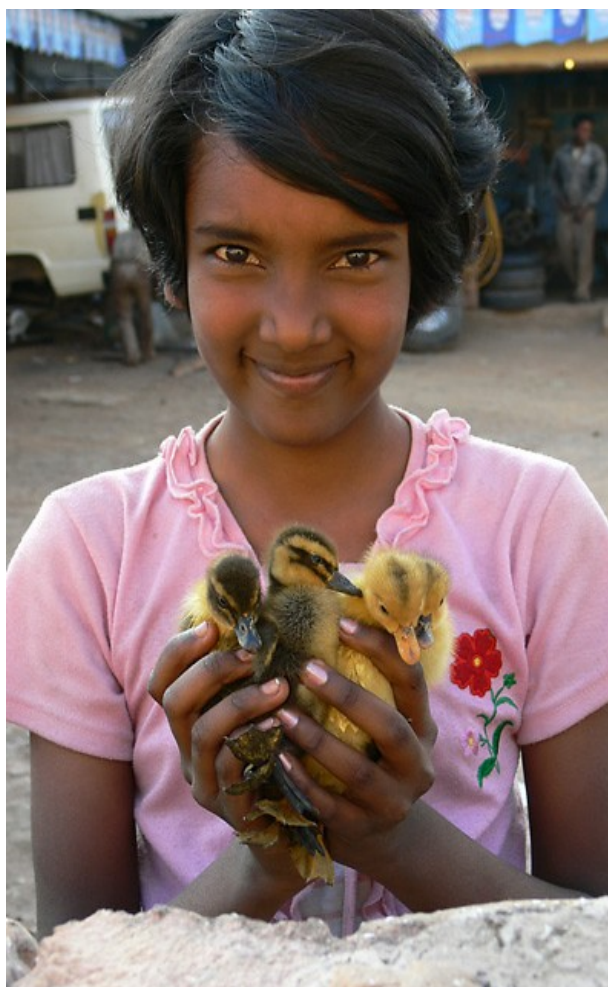
Dankbarkeit — des Lebens Erinnerung an Gottes' Geschenk

Die Photographien zeigen Mensch und Land von Myanmar/Burma