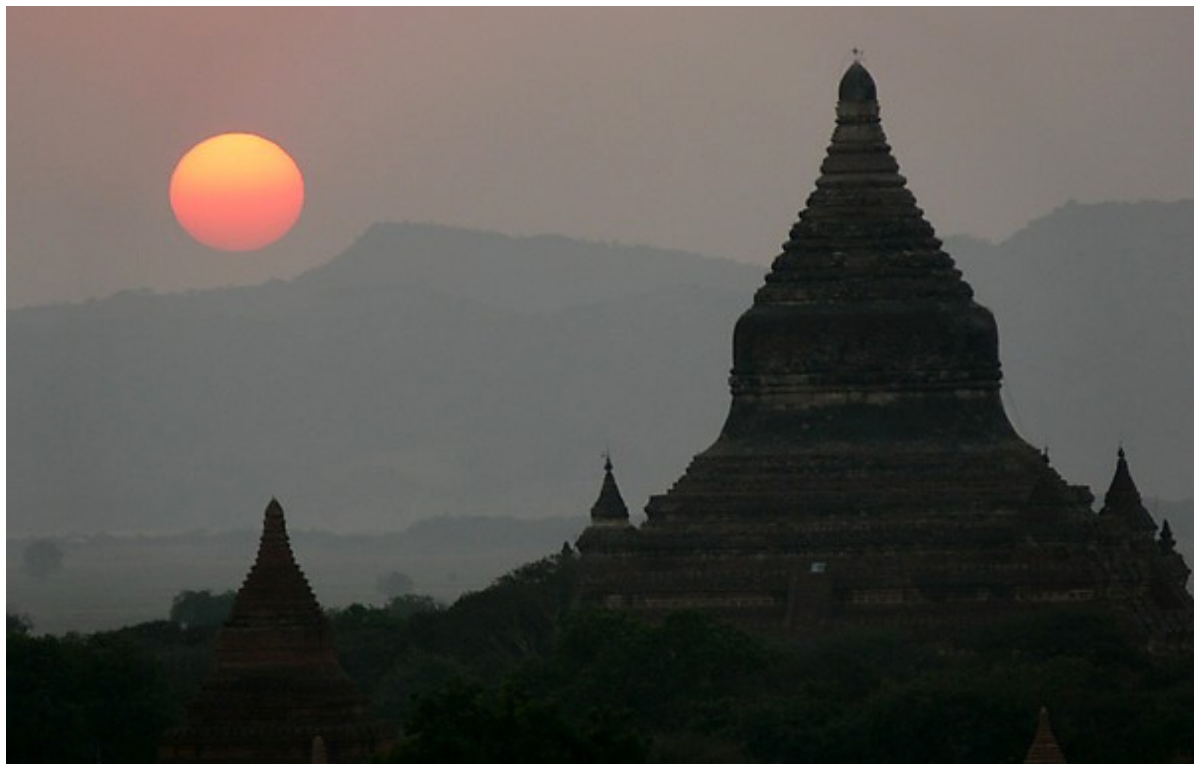
Jenseits der Dualität wartet die Einheit

Theismus bedeutet die Erkenntnis der Individualität als essentielle Eigenschaft sowohl des Relativen als auch des Absoluten. Wir sind individuell (= unteilbar, ewig), weil das Absolute individuell ist. Wenn wir nur uns als spirituelle Individuen sehen und nicht auch den Schritt der Erkenntnis der Individualität Gottes vollziehen, sind wir immer noch im Bereich des Atheismus, hier allerdings nicht mehr im Bereich des materiellen Atheismus, sondern des metaphysischen und esoterischen Atheismus. Der weiterführende Erkenntnisweg ist hier der monistische, z. B. buddhistische Nontheismus (als Aspekt des theistischen Monismus).