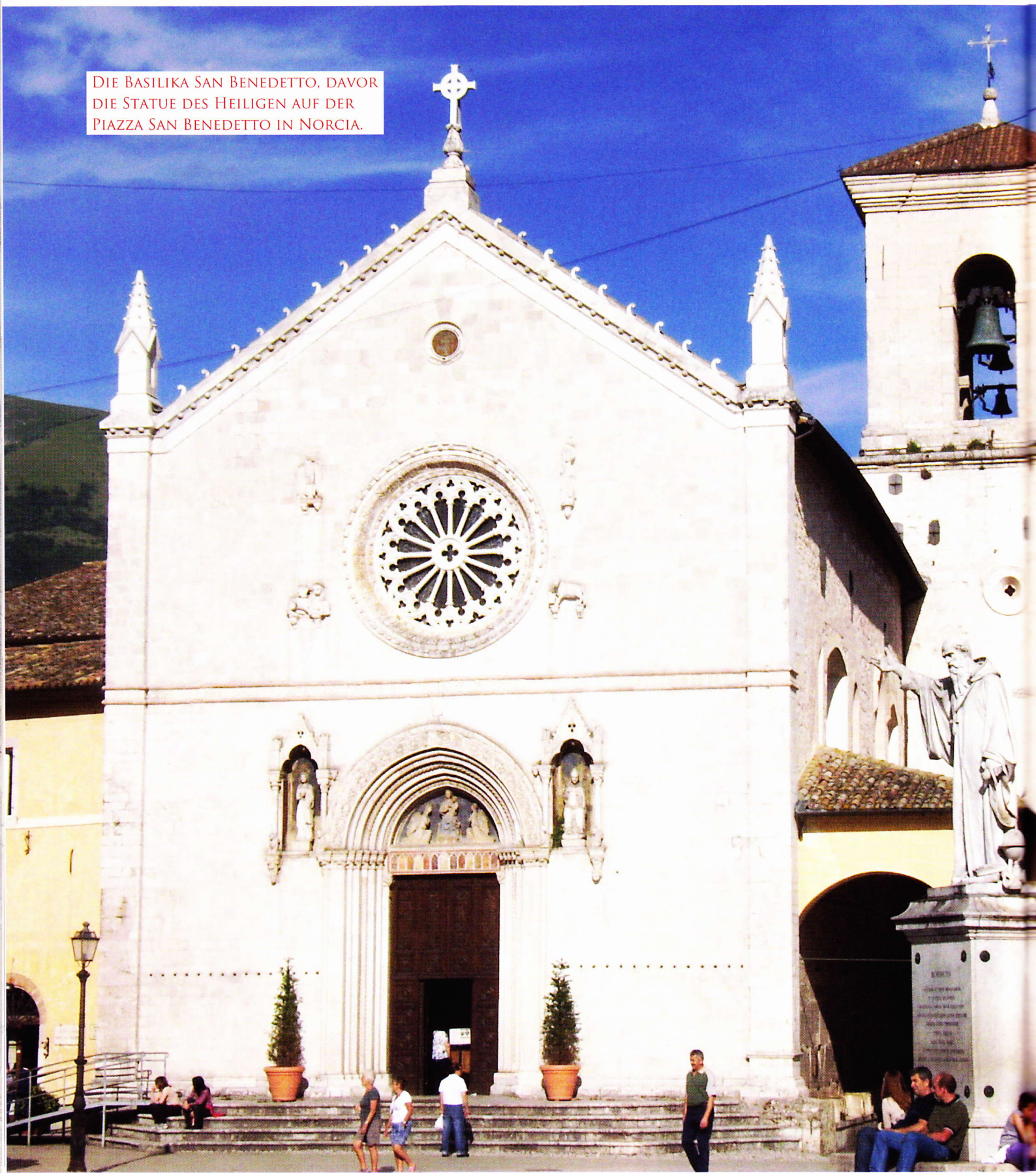
DIE BASILIKA SAN BENEDETTO, DAVOR DIE STATUE DES HEILIGEN AUF DER PIAZZA SAN BENEDETTO IN NORCIA.