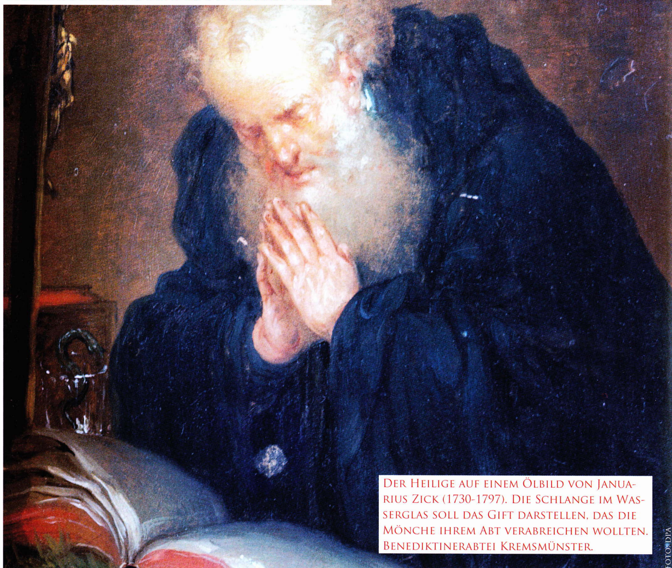
DER HEILIGE AUF EINEM ÖLBILD VON JANUARIUS ZICK (1730-1797). DIE SCHLANGE IM WASSERGLAS SOLL DAS GIFT DARSTELLEN, DAS DIE MÖNCHE IHREM ABT VERABREICHEN WOLLTEN. BENEDIKTINERABTEI KREMSMÜNSTER.